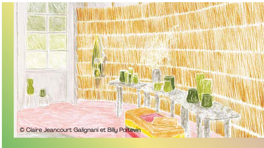
© Claire Jeancourt Galignani et Billy Poitevin

Dans la recherche de matières naturelles de leur projet intitulé « Le sel, la Sagne et la Salicorne » qui s'inscrit dans une valorisation du littoral camarguais, Claire Jeancourt Galignani et Billy Poitevin ont suspendu sur une structure panneau en bambou une veste en Lin européen dont le tissu fourni par Libeco a été rebrodée de laine camarguaise teintée par les algues, ce qui apporte une touche de couleur et surtout de créativité au décor.